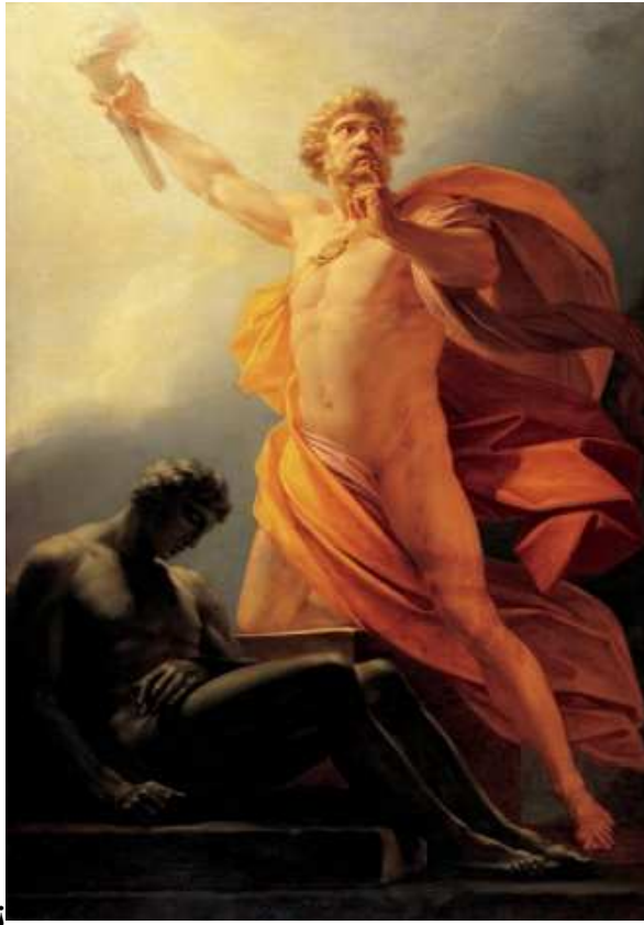
Prometheus by Heinrich Friedrich Füger (c. 1817).